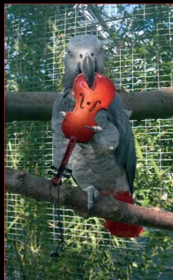
alien productions.

Schloss Wolkersdorf, FLUSS-Büro, Dunkelkammer / office, darkroom Termine auf Anfrage / on request